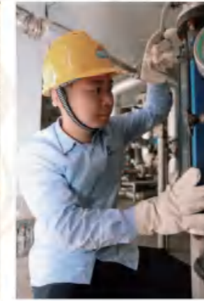
纪祥 精益求精，安全无忧