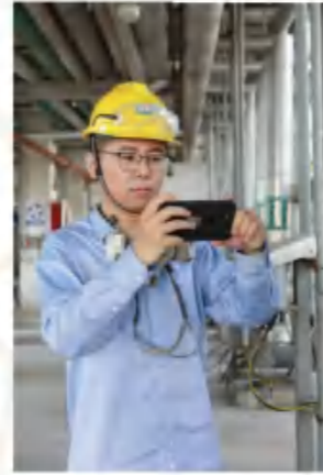
刘云 安全生产，人人参与； 事故预防，人人有责