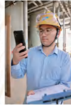
鹏飞 事故不难防，重在守规章